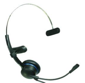
AirTalk 3000 XS Flex